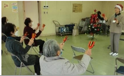
リズムに合わせて♪

全員にもれなく景品が当たりみんな嬉しそうでした。休憩後、ケーキセットを頂きながら楽しいクリスマス会は終わりました。