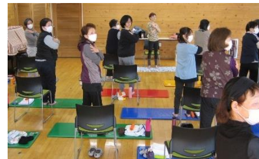
ゆるりゆっくりと～

地区親善交流4コートゲーム大会 二月十一日 昨年に引き続き、泉が森体育館で南部4地区親善の4コートゲーム大会が行われました。以前は4地区対抗でソフトボールの大会を行っていましたが、地区ごとにチームが組めなくなってきたことから、誰もが参加できる4コートゲームを行うことになりました。 久慈地区からは小学校、中学校の生徒と先生方が参加しました。結果は振いませんでしたが、館内に響き渡った、中学生の元気な声が大好評でした。後片付けや清掃モップ掛けも率先して手伝ってくれました。