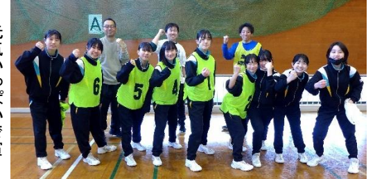
元気いっぱい受賞

地区親善交流4コートゲーム大会 二月十一日 昨年に引き続き、泉が森体育館で南部4地区親善の4コートゲーム大会が行われました。以前は4地区対抗でソフトボールの大会を行っていましたが、地区ごとにチームが組めなくなってきたことから、誰もが参加できる4コートゲームを行うことになりました。 久慈地区からは小学校、中学校の生徒と先生方が参加しました。結果は振いませんでしたが、館内に響き渡った、中学生の元気な声が大好評でした。後片付けや清掃モップ掛けも率先して手伝ってくれました。