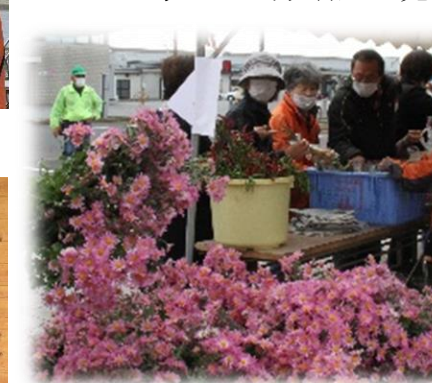
華やかな菊の花いかがですか？

また、二階では、くじ保育園児や久慈小児童の絵、地域福祉部の写真や成華園入所者等の各種作品の展示品を熱心に見入っている方が大勢でした。