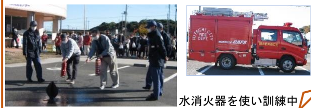
水消火器を使い訓練中

これから気温も下がり暖房器具の使用も多くなると思いますが、空気が乾燥する時季でもありますので皆様も「火の元」にご注意ください。