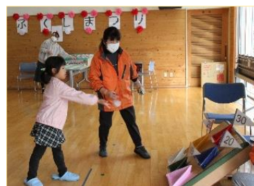
はいれ～!!（ニューバゴーン）

また、二階では、くじ保育園児や久慈小児童の絵、地域福祉部の写真や成華園入所者等の各種作品の展示品を熱心に見入っている方が大勢でした。