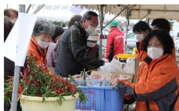
赤いとうがらし 食べて良し 飾っても良し！