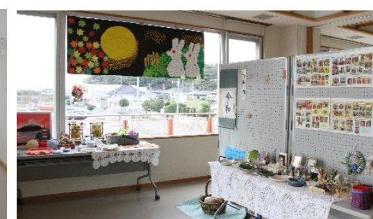
成華園の作品を展示