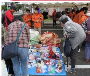
掘り出し物はあるかなあ～