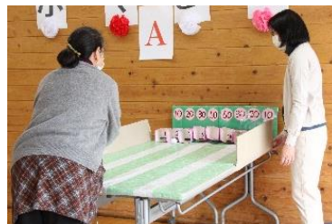
何点でるかな～（卓上ポーリング）