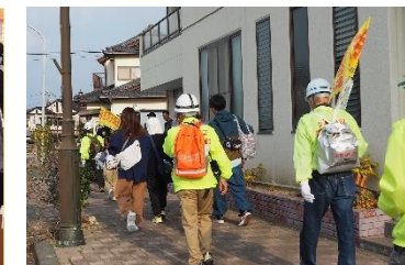
避難所を目指して