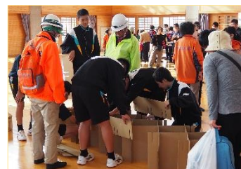
段ボールベッド組立て